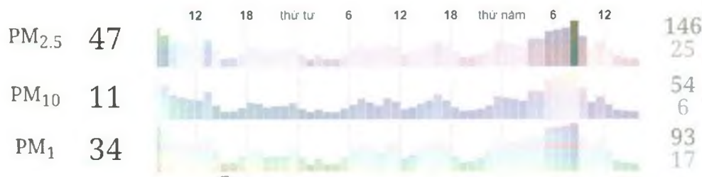
Hình 1: Kết quả chỉ số chất lượng không khí (AQI) tại trạm cảm biến trung tâm thành phố Cần Thơ tháng 8-2022