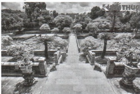
Hình 3. Thủ pháp nhấn mạnh địa hình được thể hiện qua hàng loạt sân chênh cốt liên hệ với nhau bằng các bậc thang, các công trình

Chúng ta có thể thấy nguyên tắc vừa nhấn mạnh địa hình vừa xử lý địa hình đã được sử dụng một cách tinh tế trong kiến trúc cảnh quan lăng Minh Mạng. Ở đây, ông cha ta đã lợi dụng độ dốc của địa hình để bố trí hàng loạt sân chênh cốt liên hệ với nhau bằng các bậc thang trên một trục bố cục chính.