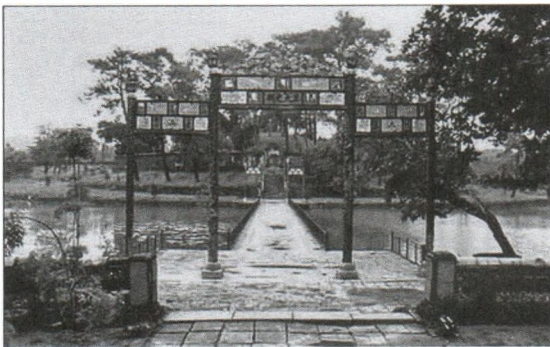
Hình 6. Hồ Tân Nguyệt – hình vầng trăng non đã được xử lý lại hình dáng từ con suối có sẵn, ôm lấy Bửu Thành [4].

Phía sau hồ Trường Minh là hồ Tân Nguyệt được tạo hình vầng trăng non - tượng trưng cho yếu tố “âm”, ôm lấy một phần khu mộ vua - Bửu Thành hình tròn tượng trưng cho mặt trời, yếu tố “dương”. Giữa hồ là một hệ thống hòn non bộ, quanh hồ xây lan can với những đường nét uốn lượn mềm mại và những hình thức trang trí đa dạng.