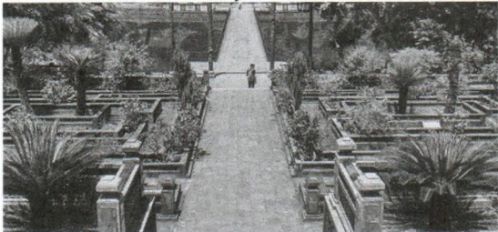
Hình 7. Bố cục hoa viên trong lăng Minh Mạng [5]

Bên cạnh đó, thủ pháp xử lý địa hình cũng được áp dụng trong cảnh quan sân vườn lăng Minh Mạng. Bố cục sân cân xứng với độ chênh cốt ít, kết hợp với cảnh quan thiên nhiên bao quanh một cách nhẹ nhàng nhờ yếu tố mặt nước và cây xanh.