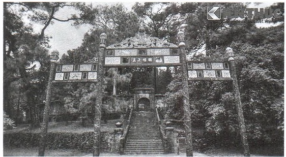
Hình 4. Mộ vua nằm giữa tâm một quả đồi mang tên Khải Trạch Sơn, được giới hạn bởi Bửu Thành. Từ chân Khải Trạch Sơn có 33 bậc cấp dẫn lên cổng của Bửu Thành, tạo cảm giác uy nghiêm, bề thế [3].

Kết thúc trục bố cục chính là nơi yên nghỉ của vua, nằm trên đỉnh đồi (Khải Trạch Sơn), việc xử lý tạo dáng địa hình thành các bậc thềm trải rộng từ chân lên đến đỉnh và kết thúc bằng Bửu Thành lại là thủ pháp nhấn mạnh địa hình tạo nên cảm giác không gian bao la hơn, công trình uy nghiêm hơn.