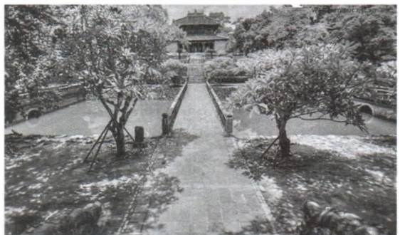
Hình 5. Hồ Trùng Minh - Ông cha ta đã sử dụng con suối có sẵn và cải tạo lại để phù

Hồ Trùng Minh vốn là một hồ tự nhiên do con suối chảy từ núi Cấm Kê ra sông Hữu Trạch, khi quy hoạch xây lăng Minh Mạng thì được cải tạo lại gồm hai nửa nối thông với nhau ở phía sau điện Sùng Ân, giống như hai lá phổi xanh bao bọc lấy các công trình kiến trúc trên trục thần đạo.