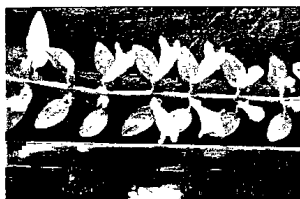
Hình 3. Hoa Thuần râu Việt Nam