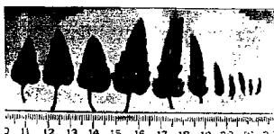
Hình 2. Lá Thuần râu Trung Quốc