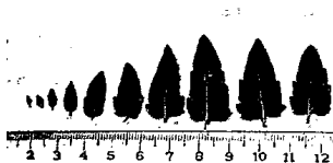
Hình 1. Lá Thuần râu Việt Nam