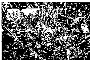
Hình 4. Hoa Thuần râu Trung Quốc