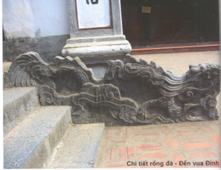
Chi tiết rồng đá - Đền vua Đinh