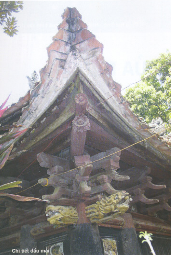
Chi tiết đầu mái

Là những thành phần kiến trúc được xây dựng trong nhiều thời kỳ, nhưng đạt được sự thống nhất về quy hoạch, bố cục tổ chức không gian, ăn nhập về hình khối và xử lý chi tiết kiến trúc.