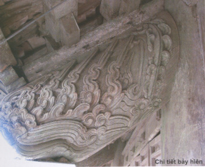
Chi tiết bày hiện