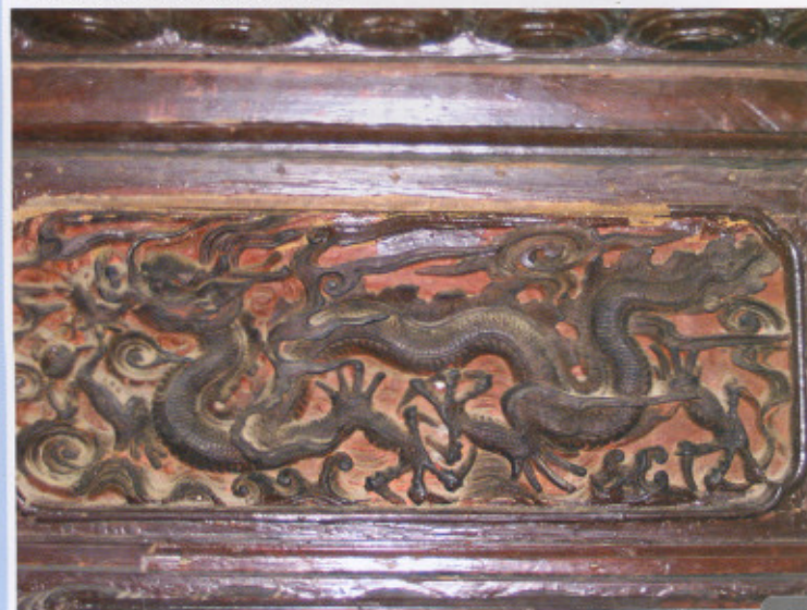
Chạm khắc rồng thời Lý