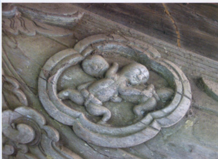
Chạm khắc thời Trần trên bộ vì