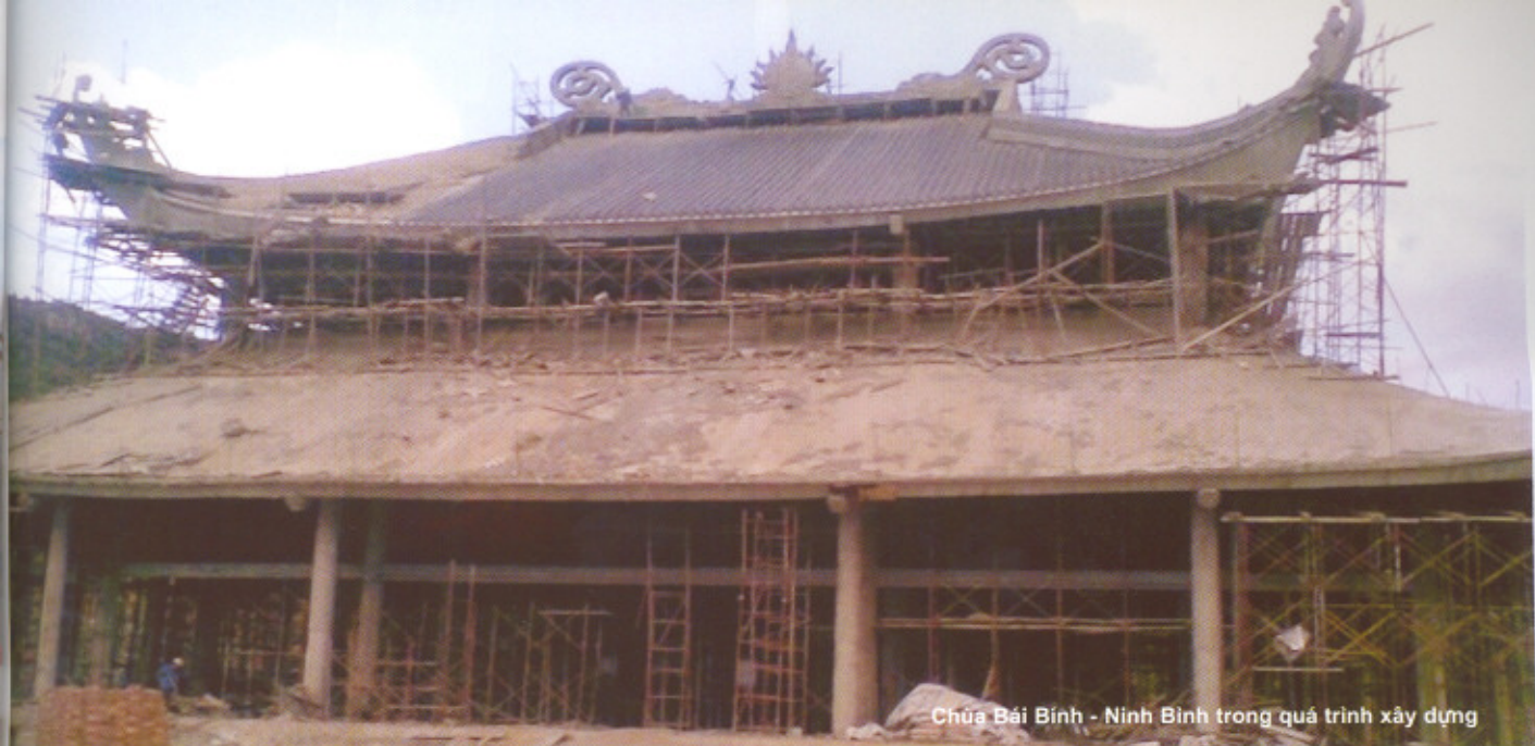
Chùa Bái Bình - Ninh Bình trong quá trình xây dựng