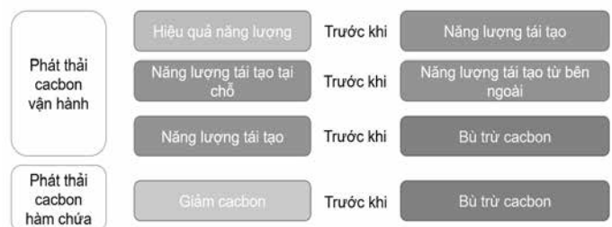
Hình 3. Cách tiếp cận để đạt được NZCB của Viện Tài nguyên thế giới (Nguồn tham khảo: WRI, 2019).

Theo WRI (2019), cách tiếp cận để đạt được NZCB thông qua sự kết hợp giữa các giải pháp hiệu quả năng lượng, năng lượng tái tạo và bù trừ cacbon được xem xét thực hiện theo thứ tự ưu tiên như thể hiện ở Hình 3.